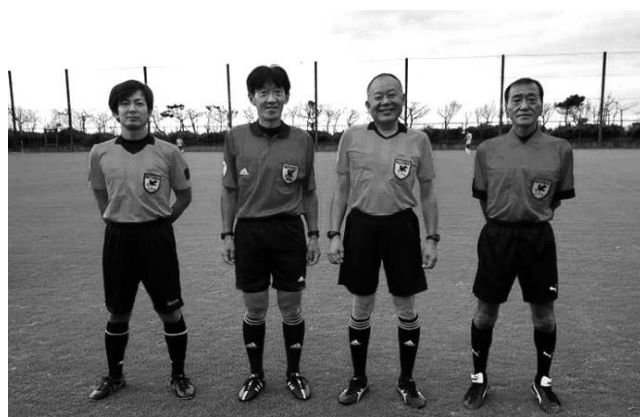
千葉市の審判仲間と！(左から2番目が私です)

今回、20年の節目となりましたが、「いつまで現役でいられるか？」自分で自分を叱咤しながら、大好きな審判を少しでも永く続けられるように日々努力し、各会場で審判仲間と楽しく審判し、サッカーに恩返ししたいと思います。これからもよろしく願います。